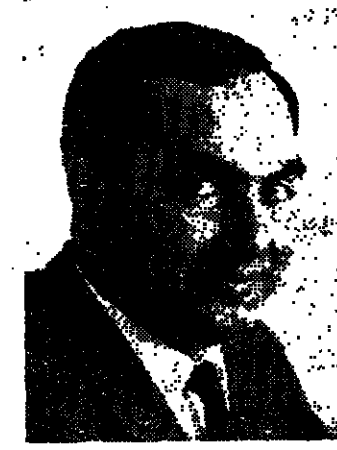
رئيس القسم العربي في دائرة الإرشاد المركزية